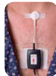
Bild rechts: Platzierung des Schnarchmikrofons und des Körperlage-Sensors an einem männlichen Patienten.

4 Entfernen Sie durch Abziehen die Papierstreifen auf den Klebeetiketten auf der Rückseite des Körperlage-Sensors.